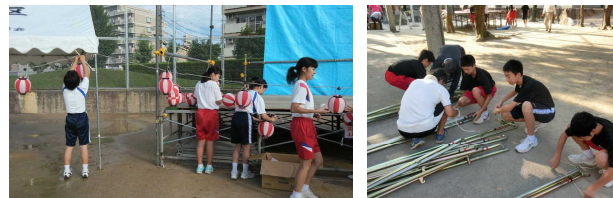
【夏祭りの準備・片付けの手伝い】

夏祭りの手伝い後のアンケートでは、おおむね指示にきちんと従い、一生懸命にできたことがうかがえます。また、「来年も手伝い等に参加したいか？」の問いにも「ぜひ」と回答した生徒が73%と多く、生徒がやりがいや自己有用感を感じ、来年度への参加に大変意欲的なことがわかりました。以下は、生徒の感想からです。 ・最近では地域の行事にほとんど参加していなかったの、いい場をつくってもらったと思って全力で手伝いを頑張りました。夕方、準備を手伝った祭りに行き、無事に開催されることがわかりとても安心しました。(野球部2年) ・地域の方々の笑顔での「ありがとう！」にとっても感動しました。その笑顔と「ありがとう」のお陰で、手伝うことにとってもやりがいを感ずることができました。テントの準備、片付け、小さい子の面倒もみて、とても大変だったけど、また来年、そして再来年も地域の役に立てるように手伝いをしていき、地域の皆さんの笑顔が見たいです。(女子バスケット部1年)